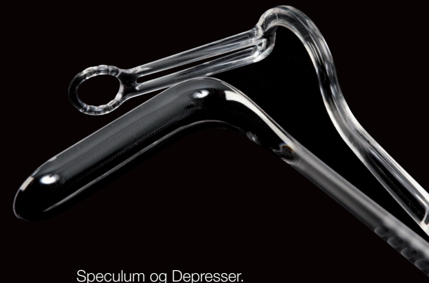
Speculum og Depresser.