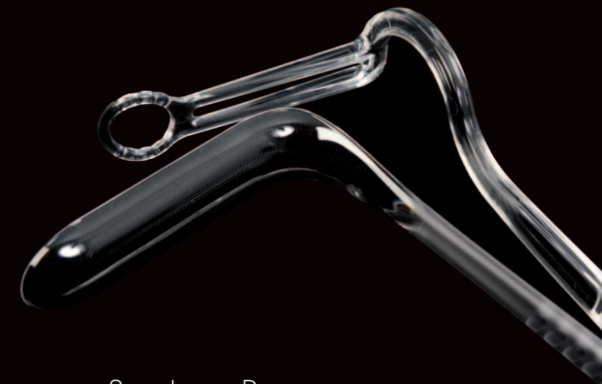
Speculum og Depresser.